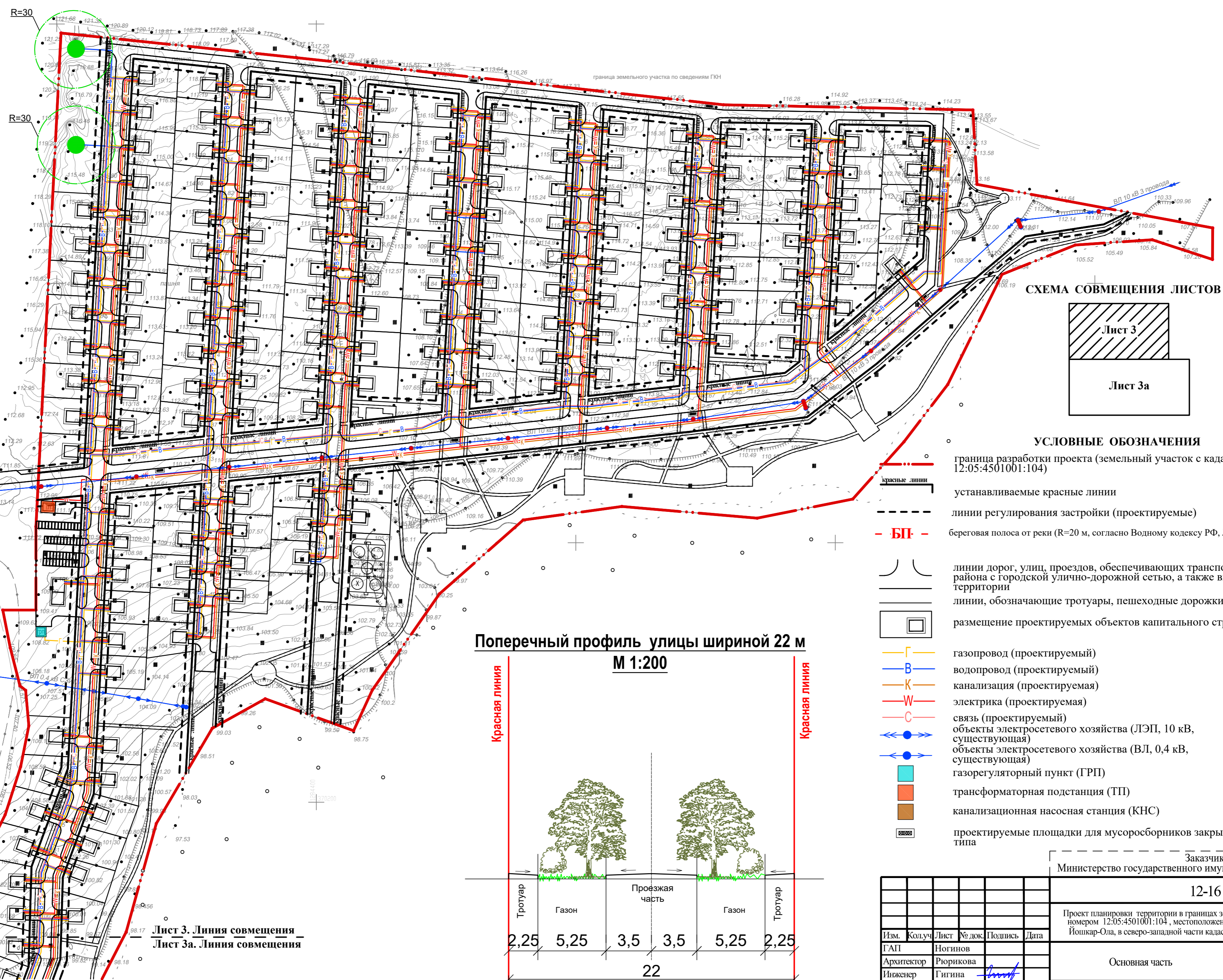
СХЕМА СОВМЕЩЕНИЯ ЛИСТОВ