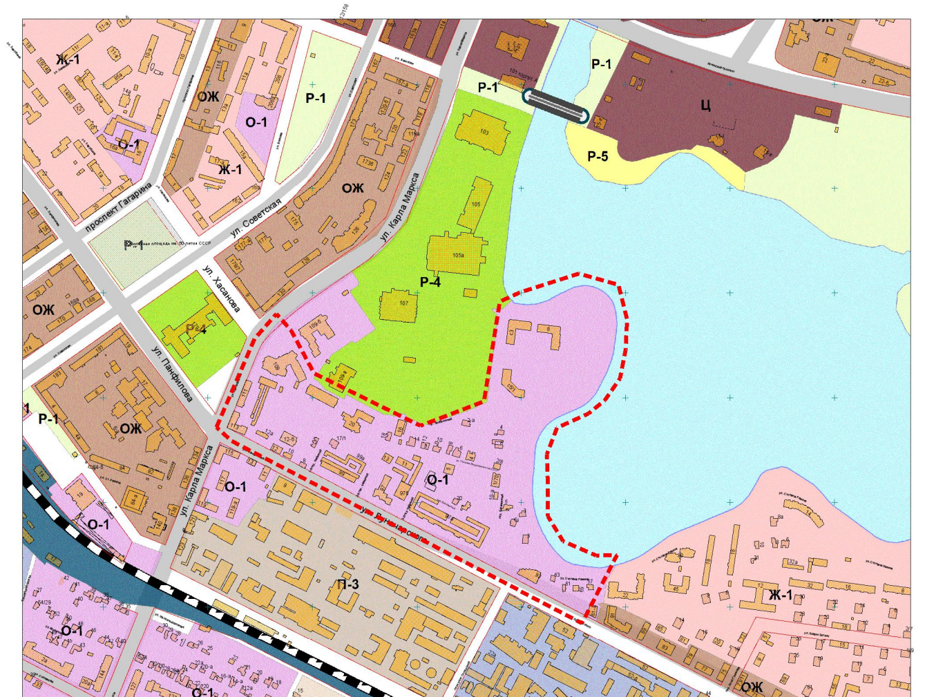
КАРТА ГРАДОСТРОИТЕЛЬНОГО ЗОНИРОВАНИЯ.