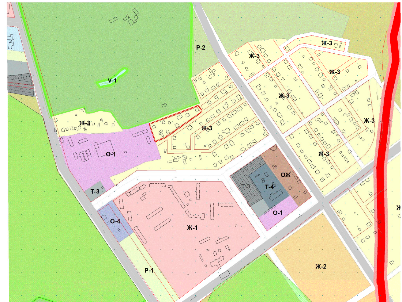
КАРТА ГРАДОСТРОИТЕЛЬНОГО ЗОНИРОВАНИЯ.