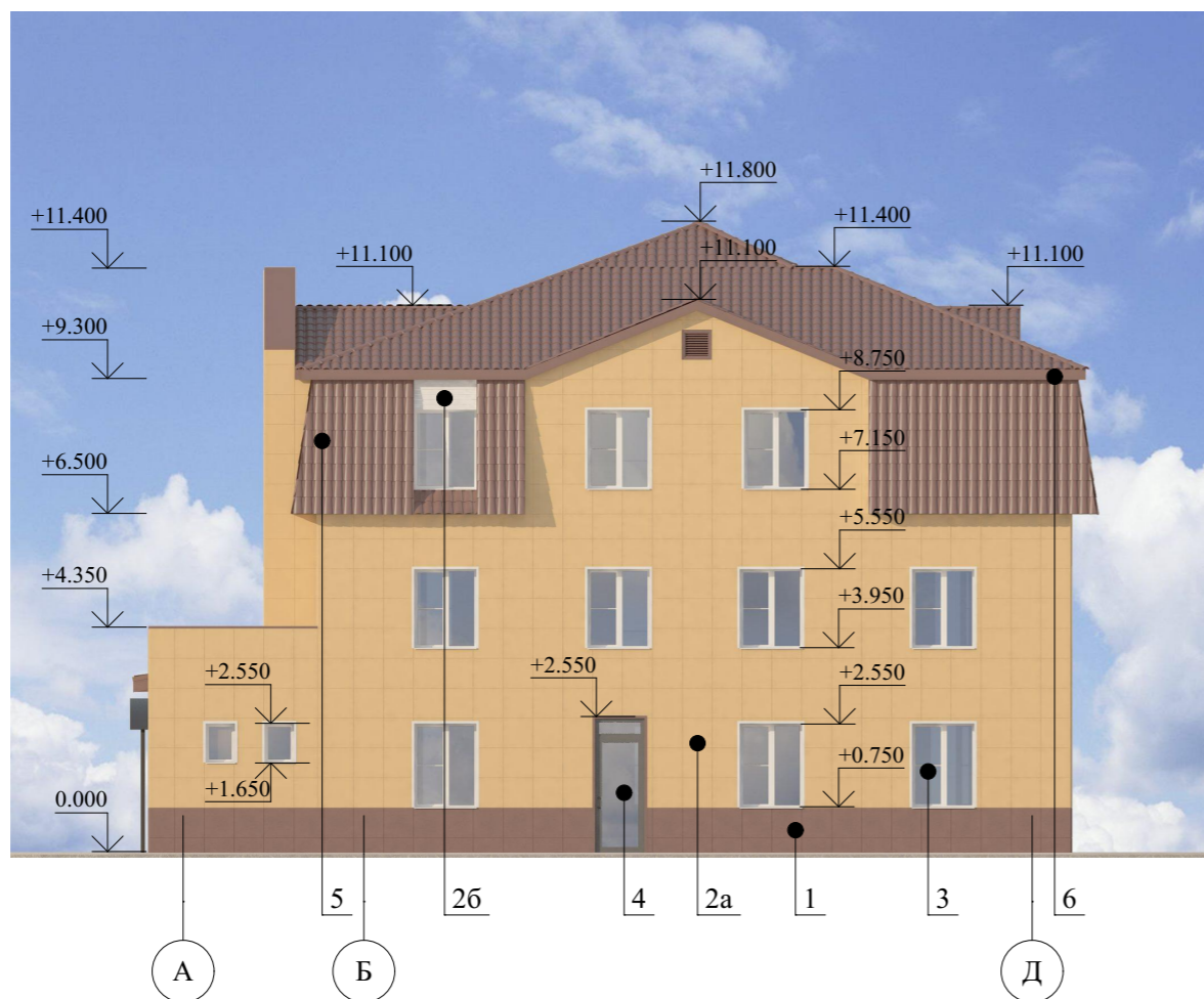
Фасад в осях "Д-А"