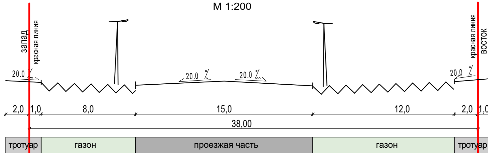
КОНСТРУКТИВНЫЙ ПОПЕРЕЧНЫЙ ПРОФИЛЬ ул. Комсомольской на участке от ул. Льва Толстого до ул. Пролетарской М 1:200