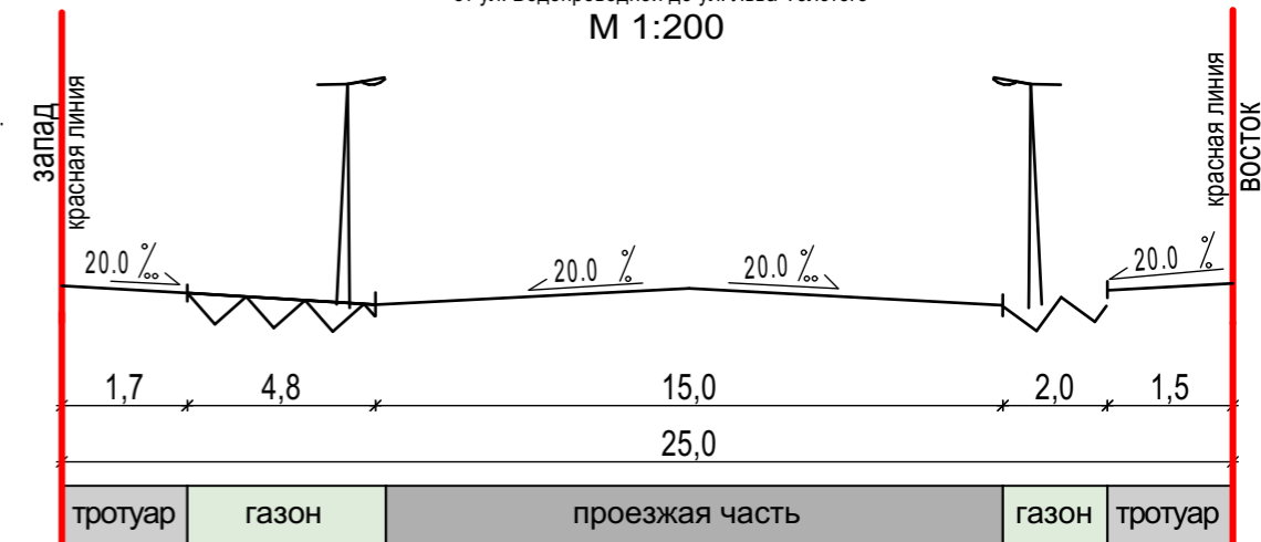
КОНСТРУКТИВНЫЙ ПОПЕРЕЧНЫЙ ПРОФИЛЬ ул. Комсомольской на участке от ул. Водопроводной до ул. Льва Толстого М 1:200